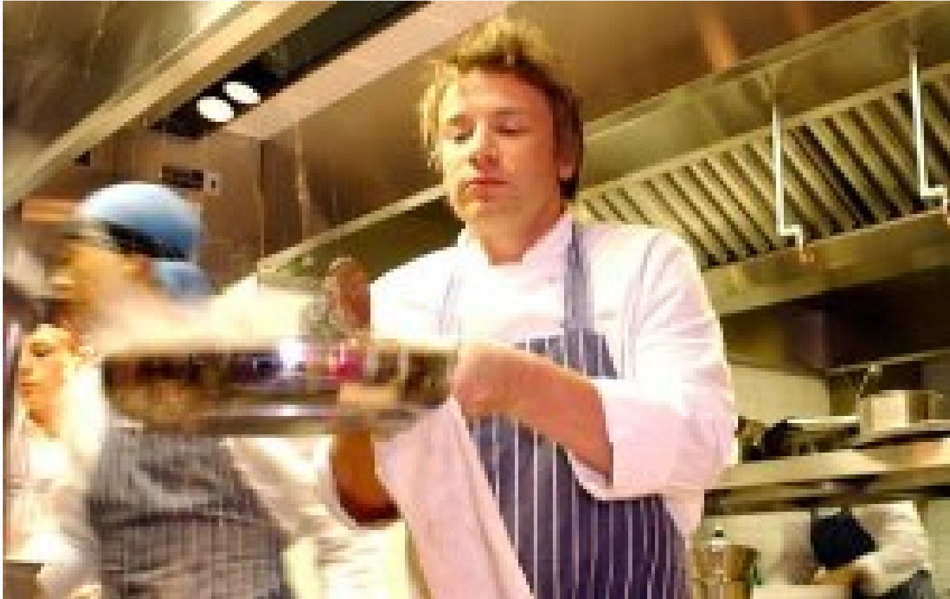
Jamie Oliver, topkok