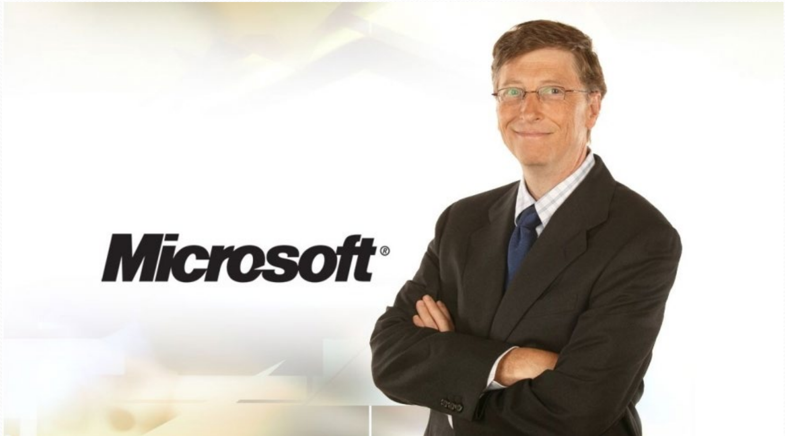
Bill Gates, baas van Microsoft