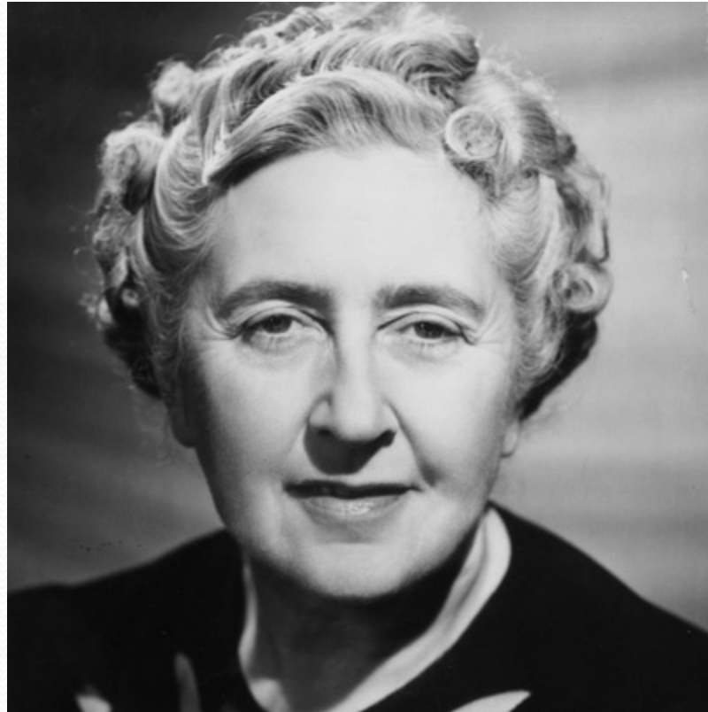
Agatha Christie, auteur