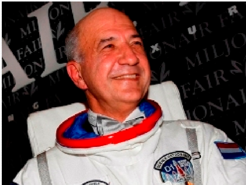
Wubbo Ockels, astronaut/ hoogleraar